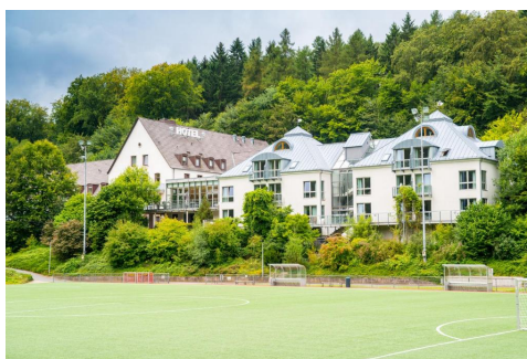
Sporthotel Fuchsbachtal, Bergstrasse 54, D-30890 Barsinghausen

Das Doppelzimmer kostet 110,- € incl. Frühstück pro Nacht